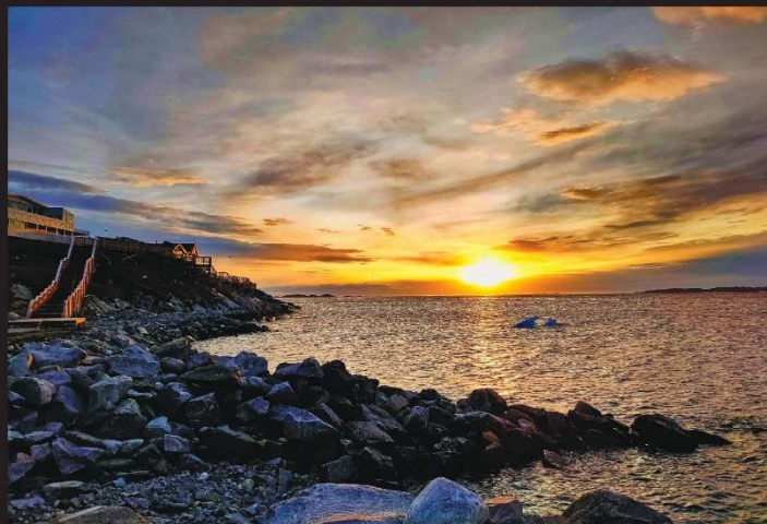
"Le panorama sur la baie de Nuuk, toute proche, où le ciel bas mordait une immensité de mer givrée, valait la peine d'endurer l'exposé pontifiant de leur hôte" (Qaanaaq)